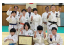
伊予双葉柔道会(愛媛県)