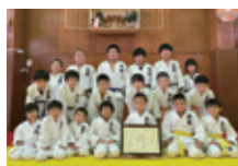
岩国少年柔道クラブ(山口県)

勝負 だけ にこだわる方は 出場をご遠慮ください マナー賞を最高の栄誉として 掲げている大会です。