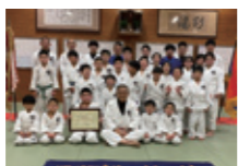
晩柔道少年団(山口県)