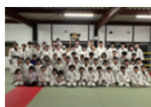
光洋柔道クラブ(大阪府)