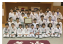
松任柔道スポーツ少年団(石川県)