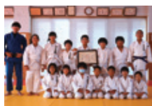
舟川柔道塾(埼玉県)

勝負だけにこだわる方は 出場をご遠慮ください マナー賞を最高の栄誉として 掲げている大会です。