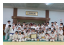
富山武道館(富山県)