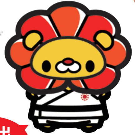
スポーツひのまるキッズ公式キャラクター 「ろくすけ」

三笠艦記念スポーツひのまるキッズ関東小学生柔道大会では、親子の絆をテーマに「頑張っている子供とそれを見守る親」という場を提供し、親子の絆をこれまで以上に深めてもらいます。また、柔道を志す子供たちにとっては、柔道の基本を再認識し、さらなる飛躍に繋がるような大会を目指しています。今年度は新型コロナウイルスの影響により、6年生のみ、 関東地区からの参加のみ の縮小開催となります。