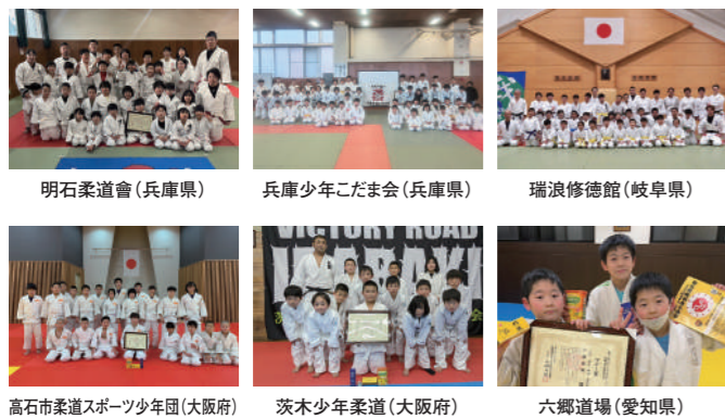
明石柔道会(兵庫県) 兵庫少年こだま会(兵庫県) 瑞浪修徳館(岐阜県) 高石市柔道スポーツ少年団(大阪府) 茨木少年柔道(大阪府) 六郷道場(愛知県)

勝負だけにこだわる方は 出場をご遠慮ください マナー賞を最高の栄誉として 掲げている大会です。