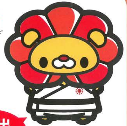
スポーツひのまるキッズ公式キャラクター 「るくすけ」

スポーツひのまるキッズ九州小学生柔道大会では、 親子の絆をテーマに 「頑張っている子供とそれを見守る親」という場を提供し、 親子の絆をこれまで以上に深めてもらいます。 また、柔道を志す子供たちにとっては、柔道の基本を再認識し、 さらなる飛躍に繋がるような大会を目指しています。 今年度は新型コロナウイルスの影響により、 6年生のみ、九州地区からの参加のみの縮小開催となります。