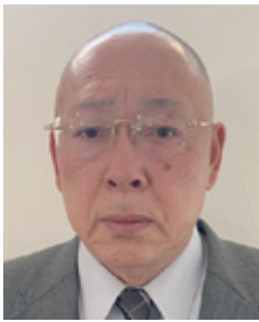
青森県柔道連盟 会長