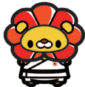
スポーツひのまるキッズ公式キャラクター「ろくすけ」