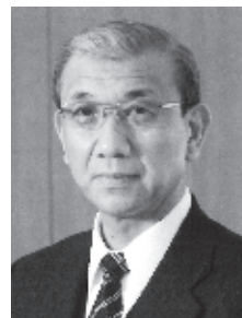
青森県柔道連盟 会長

『スポーツひのまるキッズ東北小学生柔道大会』は、お陰様で9回目を迎えました。この大会は、試合を通して親子の絆を深められる、他に類を見ないユニークな大会として、柔道関係者の間で大変好評をいただいております。さらに今年の東北大会では、できるだけたくさんの経験をしていただきたいという思いから、予選リーグ戦を行い、一人が最低2試合していただけるように致しました。多くの皆様のご参加を心よりお待ちしております。