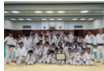
川口市柔道連盟クラブ(埼玉県)

勝負だけにこだわる方は 出場をご遠慮ください マナー賞を最高の栄誉として 掲げている大会です。