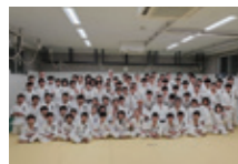
朝飛道場(神奈川県)