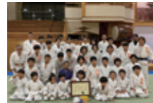
半田少年柔道教室(愛知県)