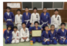
久居柔道教室(三重県)