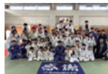
岐阜北柔道クラブ(岐阜県)