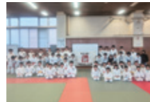
兵庫少年こだま会(兵庫県)