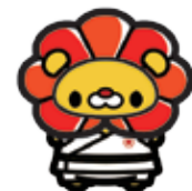
スポーツひのまるキッズ公式キャラクター「ろくすけ」